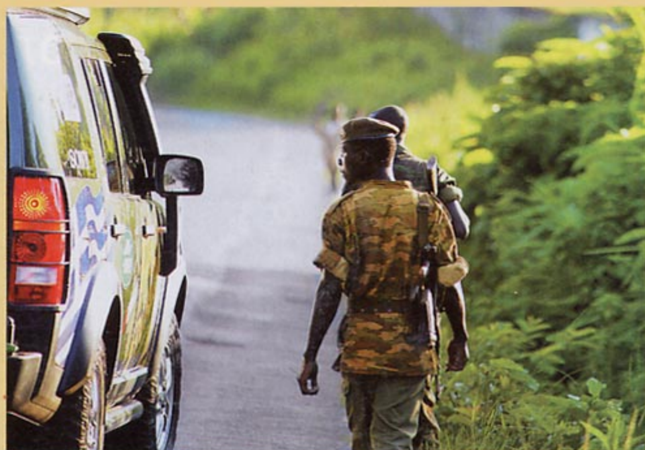
Στο Μπουρούτι η στρατιωτική παρουσία είναι ιδιαίτερα έντονη εξαιτίας της δραστηριοποίησης ομάδων ανταρτών.