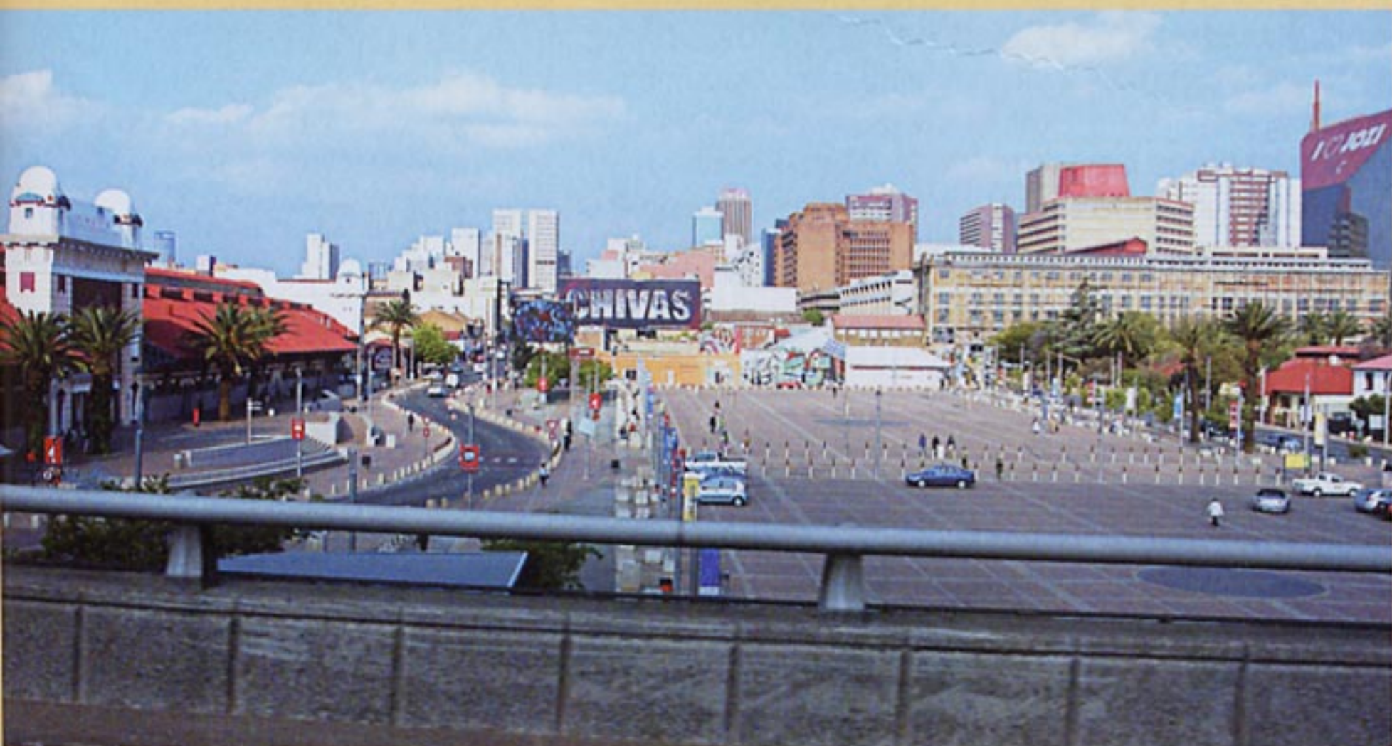
Ετά από χιλιάδες χιλιόμετρα σε ερημικές περιοχές, βλέπεις τη Νότια Αφρική και σου θυμίζει... Αμερική!

Τέλος, στη Νότια Αφρική, μετά το πρώτο πολιτισμικό σοκ (σαν Αμερική θα σας μοιάζει), θα εντυπωσιαστείτε από τον παραλιακό Garden Route, όπου μπορείτε να κολυπήσετε με λευκούς καρχαρίες και φάλαινες, να κάνετε bungee από 216 μ. ύψος και να δοκιμάσετε μερικά από τα καλύτερα κρασιά του κόσμου. Όσο για το Κέιπ Τάουν; Θα θέλετε μάλλον να μείνετε για πάντα εκεί. Γιατί όχι;