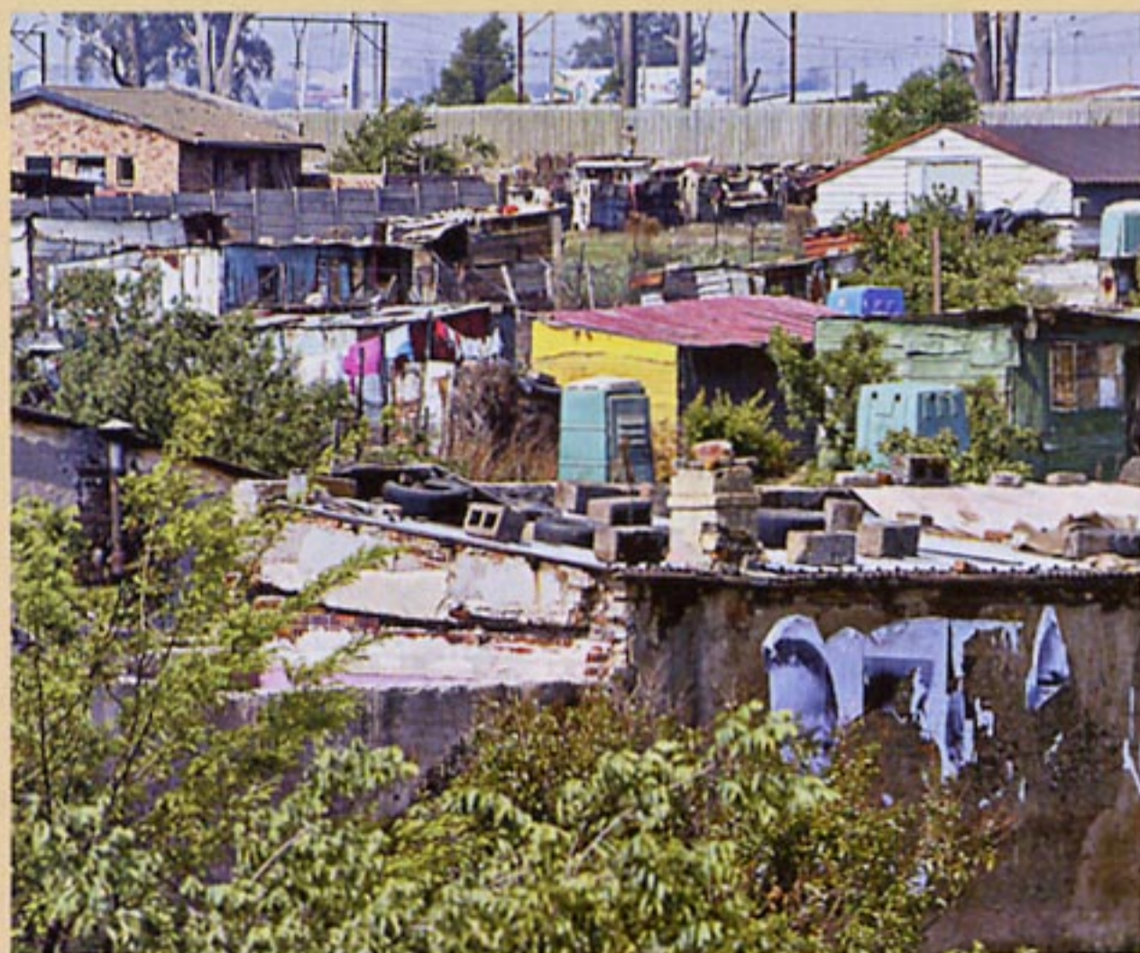
Μεγάλο ποσοστό του πληθυσμού μένει σε παράγκες.

Βιλανκούλο-Μαπούτο: 980 χλμ. Παραθαλάσσια διαδρομή,