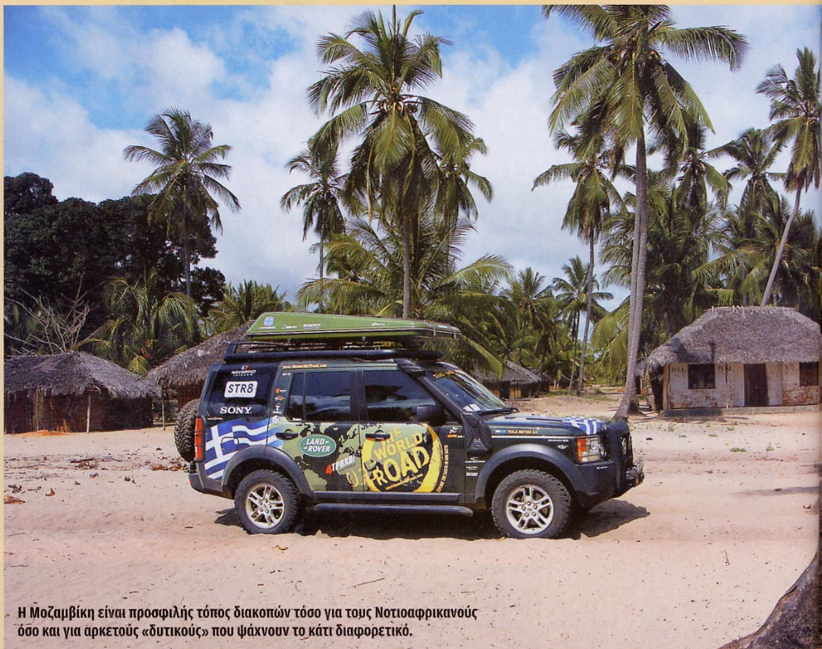
Η Μοζαμβίκη είναι προσφιλής τόπος διακοπών τόσο για τους Νοτιοαφρικανούς όσο και για αρκετούς «δυτικούς» που ψάχνουν το κάτι διαφορετικό.