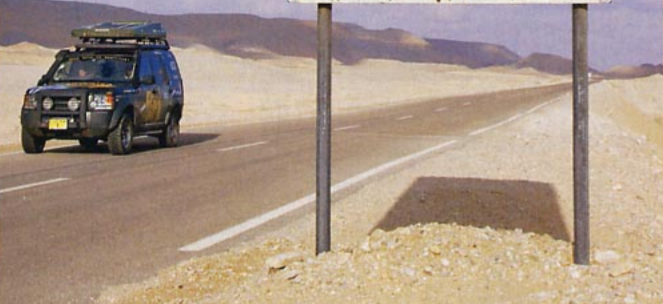
Διαφορετικά όρια ταχύτητας για κάθε τύπο αυτοκινήτου; Πολιτισμός.