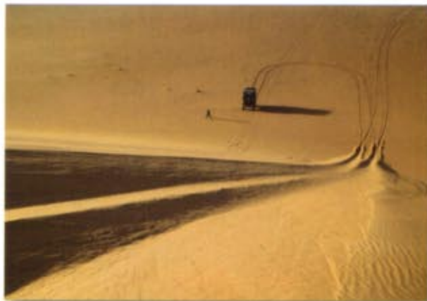
Le dune possono essere alte molti metri e superando la cresta ci si può trovare davanti ad una lunga discesa: divertimento assoluto.

viaggiato di pari passo con la volontà di farsi capire da un mondo magico chiamato Sahara circondato dal suo mistero. Ho negli occhi il miracolo del mutevole Sahariano, di incredibile bellezza i cui tremolanti arabeschi sono come quelli lasciati sulla sabbia capaci di offrirmi spunti di riflessione e osservazione. Un viaggio impossibile da dimenticare, ma anche difficile da raccontare senza rischiare di cadere nei soliti luoghi comuni. Sarò pure un granello spinto dal vento in questo mare immenso di sabbia...ma sono pur sempre parte di una duna e poi un'altra e un'altra ancora e così via, fino ad arrivare ad essere infinito, ad essere deserto con la semplicità di sentire la quiete interiore. Credo sia proprio questa l'essenza dell'essere, trovarsi e ritrovarsi per sentirsi unici, veri, puri. Sono pronta a ripartire per l'ennesimo viaggio, l'ennesima avventura. Sempre al mio posto, sempre con la stessa squadra vincente, sempre con il mio migliore compagno di viaggio... il mio cuore!!