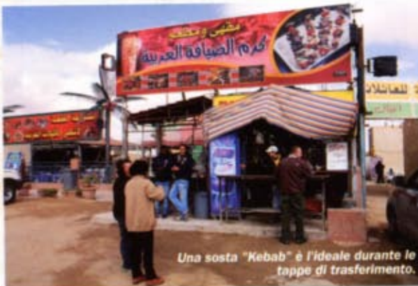
Una sosta "Kebab" è l'ideale durante le tappe di trasferimento.