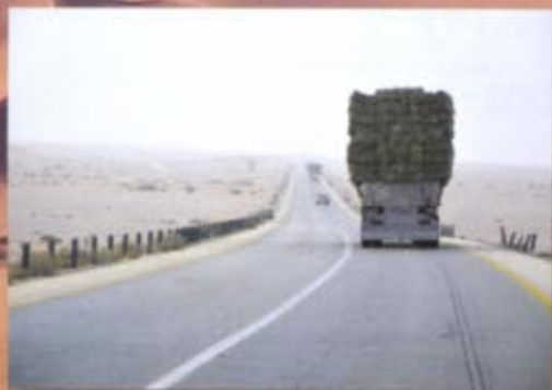
Un camion carico di fieno all'inverosimile sfida le leggi della fisica.