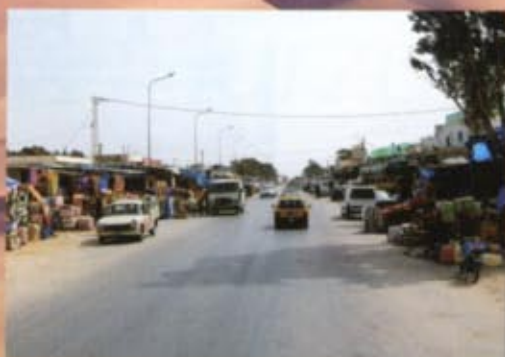
E' lungo la strada principale che si concentra la vita delle numerose cittadine che attraversiamo: mercati, botteghe d'artigiani, meccanici e piccoli market creano quella piacevole confusione che caratterizza questi luoghi.