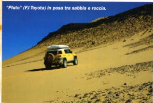
"Pluto" (FJ Toyota) in posa tra sabbia e roccia.