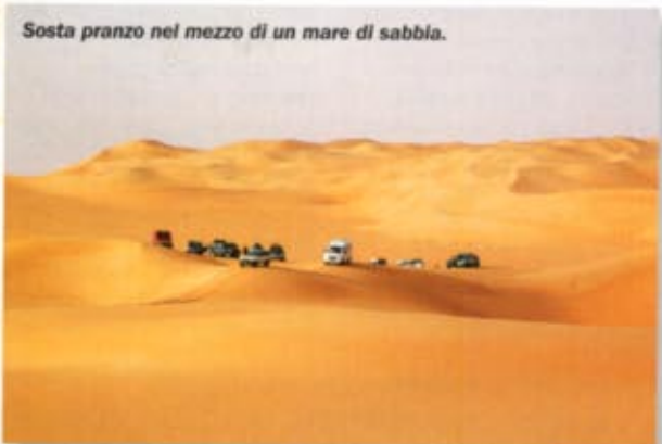
Sosta pranzo nel mezzo di un mare di sabbia.