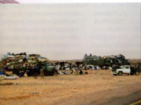
unto di ritrovo, vicino Sebha, dei camion che trasportano merce, e a volte clandestini, dal Niger.