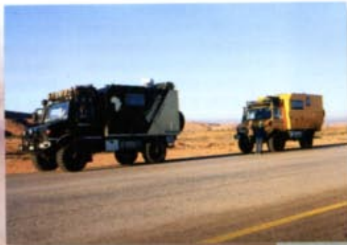
"Mog" con un altro Mercedes Unimog durante una breve sosta.